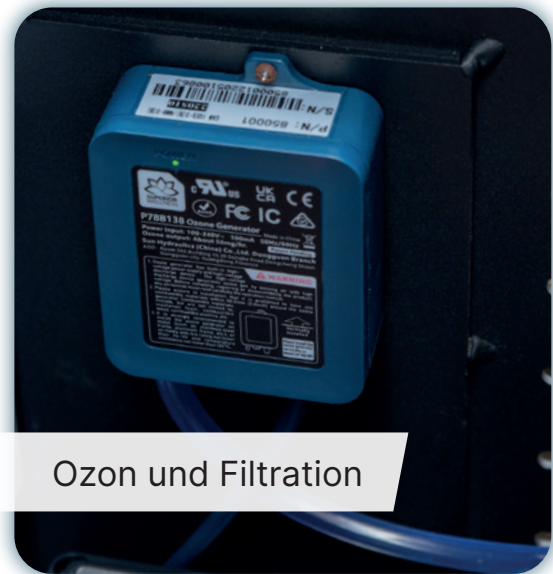
Ozon und Filtration